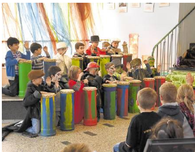
18 Jungen der Leo- und der Osterfeldschule nehmen am Projekt „Trommelwirbel“ teil.