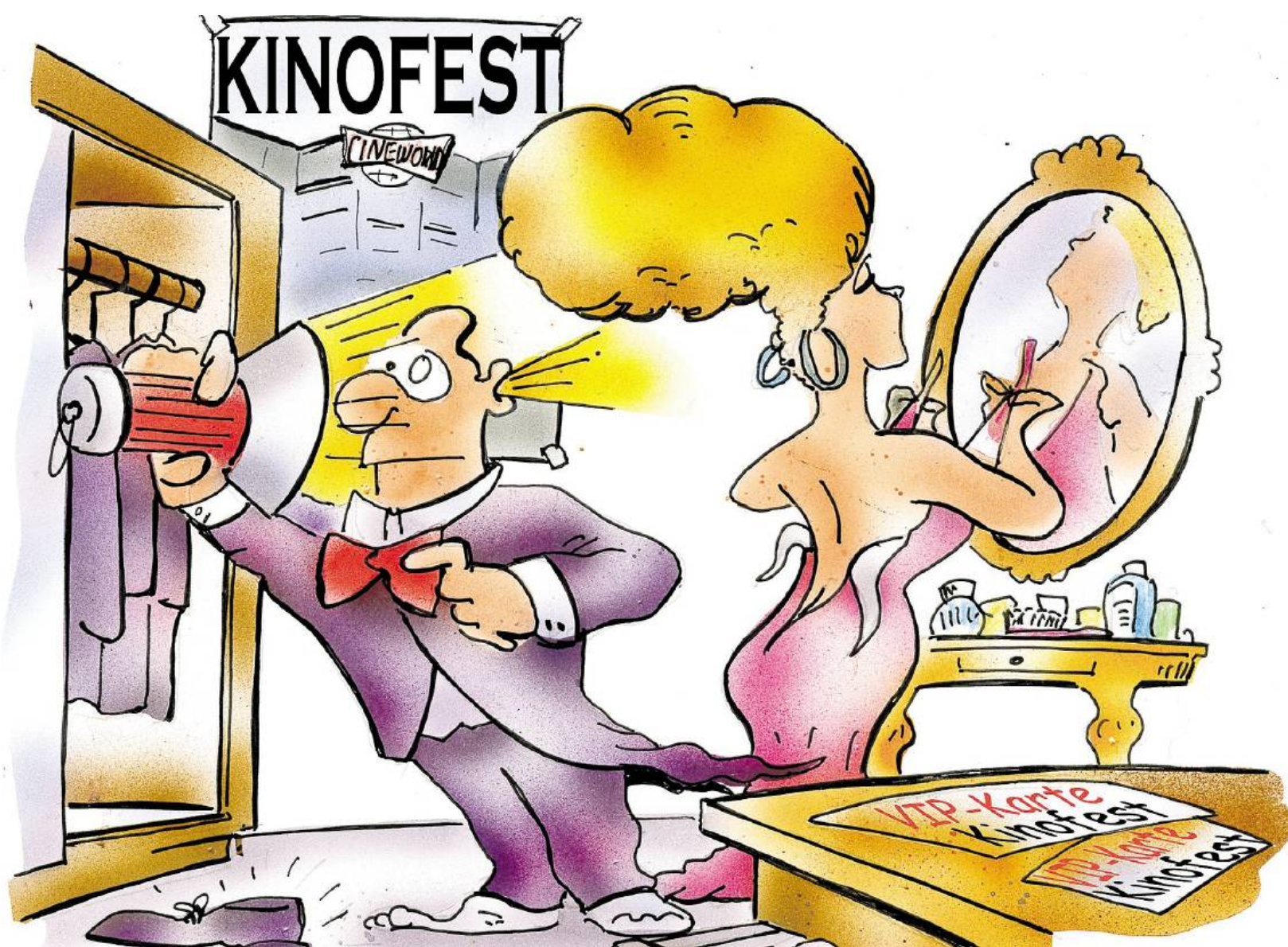
Sitzt das Haar, passt das Kleid? Lünen bereitet sich auf die Eröffnungsgala des Kinofestes vor.