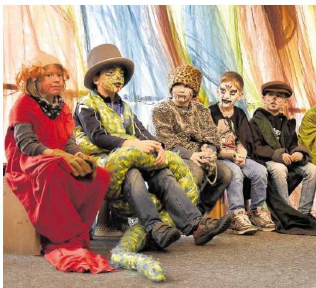
Die Tiere, die keiner mag, schließen Freundschaft und lernen, dass sie mehr können, als sie denken.

Derzeit werden drei Jungenarbeiter parallel zum Projekt ausgebildet, die die AGs leiten. Gefördert wird „Trommelwirbel“ vom Diözesan-Caritasverband Münster, der das Projekt zusammen mit dem Landesjugendamt konzipierte. Eva-Maria.Spiller@mdhl.de